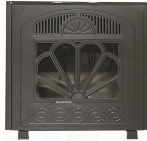
Fire Place Model GEORGIA

امکانات موجود در بخاری های بهینه سازی شده دکوراتیو سنگر کار